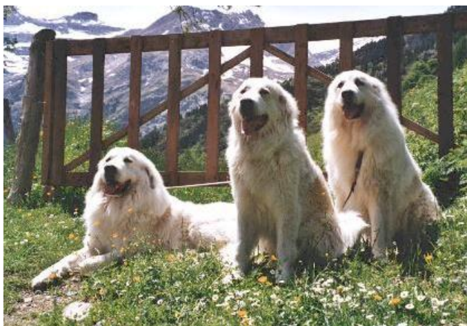
Pyrenéerhundar i rätt miljö.

Tillbaka till rasens syfte! Pyrenéerhunden är framtagen för att skydda sin flock mot rovdjur, framförallt björn och varg. Detta syfte måste alltid hållas i bakhuvudet när en pyrenéerhund bedöms, då konstruktionen är det som möjliggör hundens roll som beskyddare. Alla delar av detta kompendium kommer att återkopplas till pyrenéerhundens ursprung och orsakerna till att rasen skall vara byggd på ett särskilt sätt.