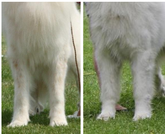
Utmärkta, parallella framställ.

Skulderläge och överarmsvinklar skall tillåta långa och elastiska rörelser, därför skall pyrenéerhunden vara utrustad med en väl ansatt skuldra och en god överarmsvinkel som tillsammans med en korrekt bröstorg skapar ett stabilt framställ.