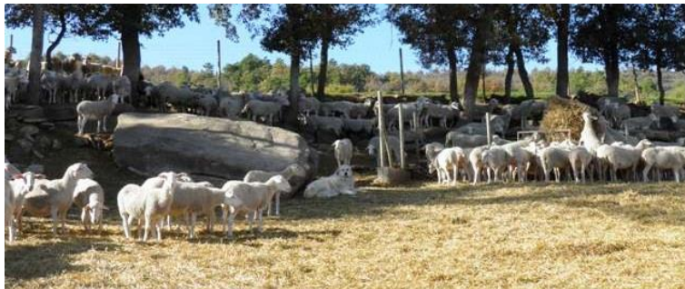
Pyrenéerhundar med olika flockar att vakta.

Pyrenéerhunden är en av de boskapsvaktande raserna som använts närmst människor. I bergen i Frankrike har flockarna inte bara gått i ensliga berg, utan ofta mycket nära byar och bebyggelse i allmänhet. Det har med grund i detta alltid funnits skäl för hundar som i mångt och mycket är trygga bland människor och som inte utgör ett hot mot de människor de träffar på.